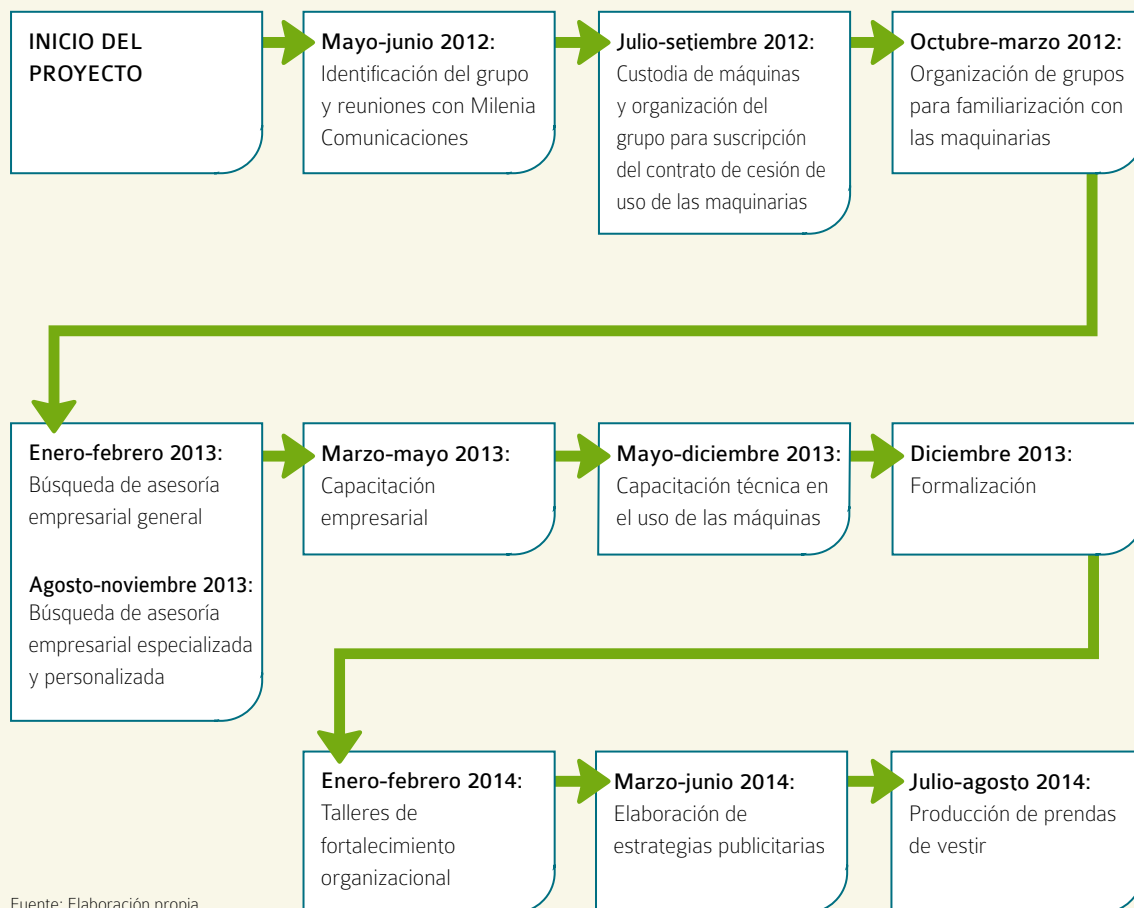
Figura 2. Línea de tiempo de la experiencia